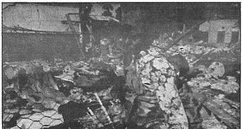
مزدوران رژیم آپارتاید خانه این زن اهل زامبیا را ویران کرده‌اند

کنگره، طی یک قطعنامه خواهان وحدت همه کمونیستهای اسپانیا در یک حزب واحد و بزرگ گردید که مهمترین ویژگیهای آن عبارتند از: حزبی براساس ملی و طبقاتی، حزبی پیشاهنگ، حزبی توده‌ای، حزبی مستقل و انترناسیونالیست، حزبی همبسته با جنبش جهانی کمونیستی، حزبی که ایدئولوژی و سیاست آن بر اصول مارکسیسم - لنینیسم استوار باشد، یک حزب لنینی که وارث بهترین سن کمونیستهای اسپانیا گردد. حزب کمونیست خلقهای اسپانیا برای تدوین برنامه این حزب و انجام بحث‌ها، پیشنهاد تشکیل یک کمیسیون ملی وحدت را می‌دهد.