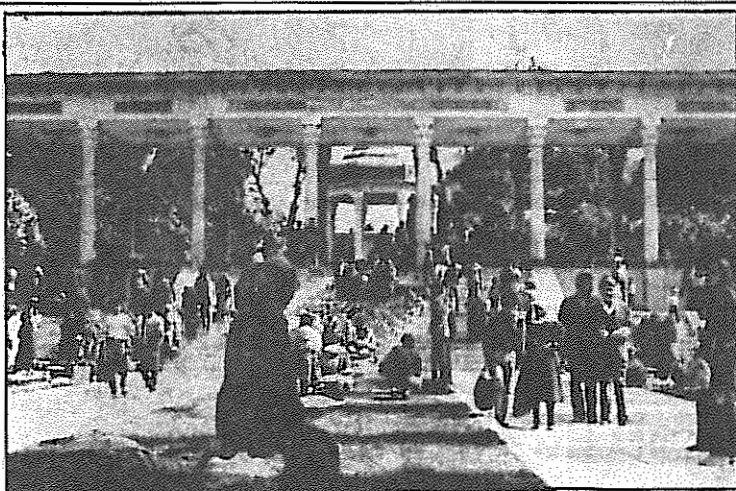
علیرغم مخالفت رژیم، حافظیه شیراز در نخستین روزهای نوروز میعادگاه هزاران ایرانی بود.

لازم به یادآوری است که در "روز کارگر" سال گذشته نیز چنین اقدامی صورت گرفته بود.