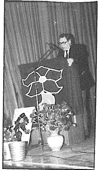
رفیق کارل هاینس شرودر، عضو هیات سیاسی کمیته مرکزی حزب کمونیست آلمان به هنگام قرائت پیام