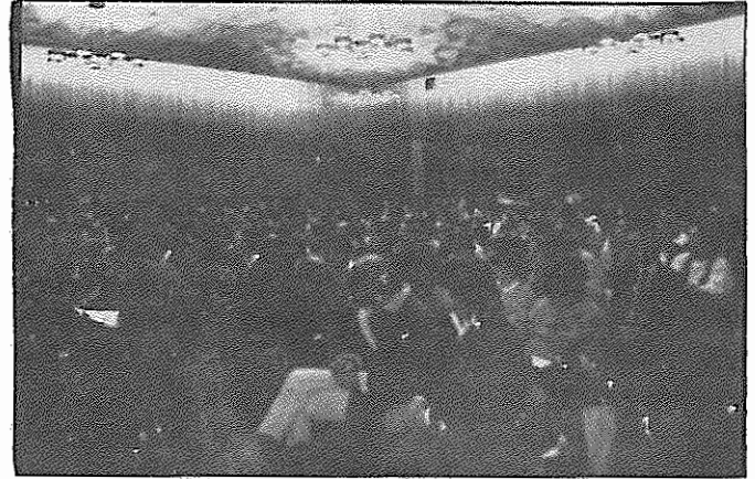
"اشتات هاله" شهر کلن مملو از جمعیتی است که از گوشه و کنار آلمان فدرال برای بزرگداشت سالروز ۱۹ بهمن گرد آمده اند