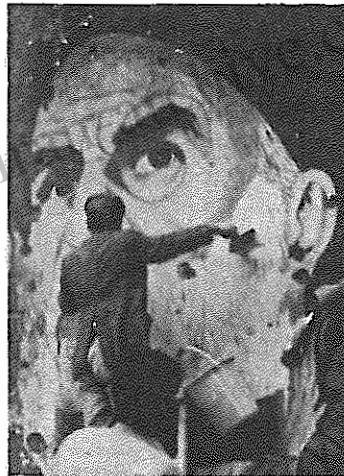
بدنبال ورود نیروهای سوری به غرب بیروت، روی عکسهای خمینی را رنگ می زنند.

معمّر قذافی رهبر لیبی در مصاحبه با روزنامه نگاران عرب در طرابلس گفت نقشه حزب الله لبنان برای ایجاد یک جمهوری اسلامی به سبک ایران در این کشور، به ناپودی نیمی از لبنان خواهد انجامید. قذافی افزود "جهاد مقدس" مورد نظر حزب الله در لبنان، به معنای تروریسم و چگونگی است.