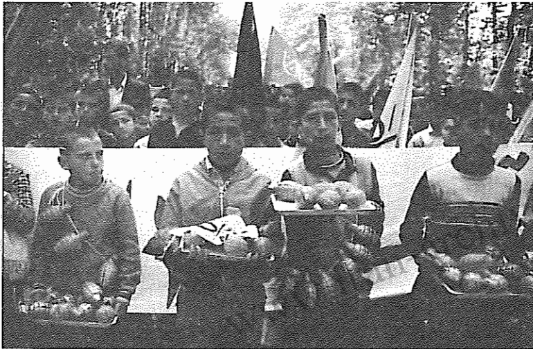
سال ۶۶ بجای "قلک" و "نانجک" از "تانک" ابرای جمع‌آوری کمک مالی به جبهه استفاده خواهد شد

مسئول ستاد درسرخان خود تاکید کرد که ۶۰ درصد نیروهای "سپاهیان صدهزار نفری محمد" و "مهدی" که در عملیات کربلای ۴ و ۵ و ۶ شرکت داشتند را دانش‌آموزان تشکیل داده‌اند. وی افزود: "ستاد" توانسته برنامه‌های نظامی خود را در استانهای یزد، اصفهان، زنجان و اراک درمقاطع مختلف تحصیلی به اجرا بگذارد. مسئول ستاد