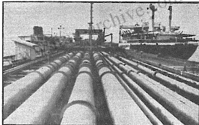
در سال ۶۵ صدور انبوه نفت ارزان برای رژیم مقدور نشد. خطوط انتقال نفت از کار بازمانده اند. اقتصاد نفتی فلج شده است.

ویژگی بحرانهای اقتصادی بدین گونه است که همواره تأثیری دوگانه بر فعل و انفعالات اقتصادی می‌گذارند. تأثیرات جاری و تأثیرات آتی. رابطه این دو گونه تأثیر، رابطه‌ای کسب‌کننده نیست. نتایج بحران حتی پیش از پدیدار شدن بر بحران جاری می‌افزایند و تأثیرات آتی بحران در فزاینده زمانی