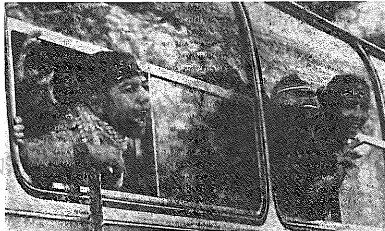
سفری بازگشت... نوجوانی ۱۴-۱۵ ساله است. شاید مادرش را صدا می‌زند این آخرین دیدار است. خمینی همچنان تشنه ریختن خون هزاران چون اوست

در ملاقات سفیر جدید آلمان فدرال با ولایتی وزیر امور خارجه جمهوری اسلامی، بار دیگر بر لزوم گسترش مناسبات دودولت تاکید شد. طرفین اظهار امیدواری کردند که در آینده نزدیک مناسبات طرفین گسترش قابل ملاحظه‌ای یابد. لازم به تذکر است که آلمان فدرال یکی از مهمترین طرف‌های بازرگانی جمهوری اسلامی محسوب می‌شود.