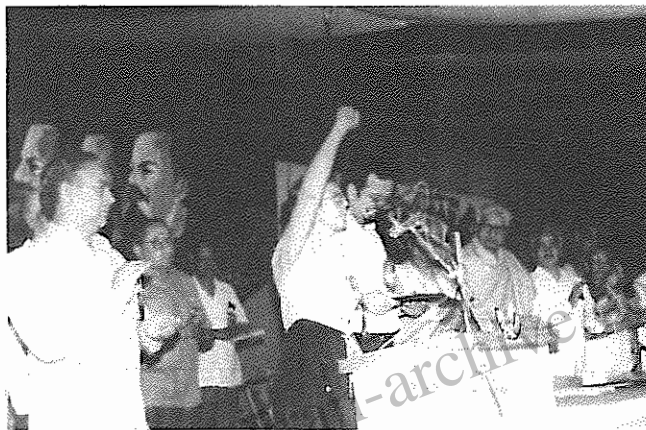
رفیق رقیه دانشگری عضو کمیته مرکزی سازمان بهنگام سخنرانی در سیزدهمین کنگره حزب کمونیست هند. در عکس رفیق ایندراجیت کوبتا دیپار اتحادیه سراسری کارگران هند و دیگر اعضای رهبری حزب نیز دیده می شوند.

سیزدهمین کنگره حزب کمونیست هند، در روز ۱۲ مارس (۲۱ اسفند) در شهر پاتنا، ایالت بیهار برگزار شد. در این کنگره از جانب ۵۰۰ هزار عضو حزب کمونیست هند، تعداد ۱۰۶۰ نفر نماینده اصلی، ۱۲۲ نفر نماینده مشاور و ۱۱۲ نفر ناظر شرکت داشتند. ۲۶ هیات نمایندگی احزاب برادر منطقه و جهان منجمله هیات های نمایندگان احزاب کمونیست کشورهای اتحاد شوروی، کوبا، ویتنام، آلمان دموکراتیک بقیه در صفحه ۲