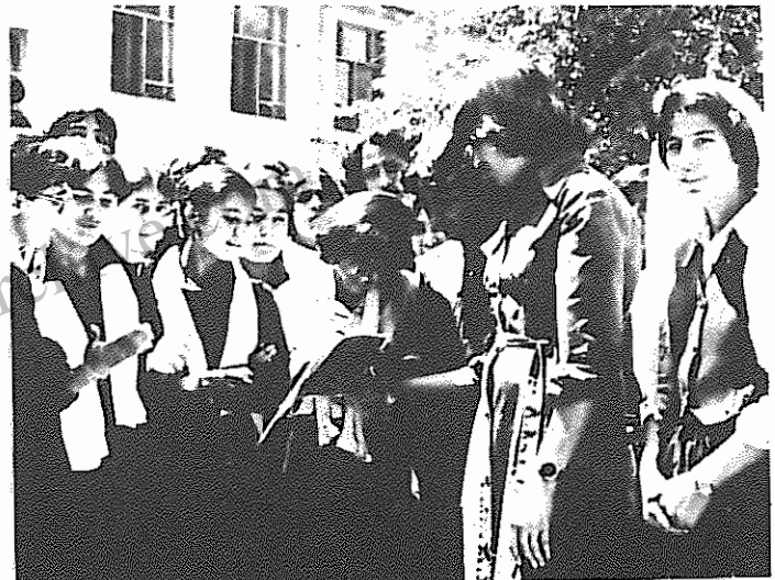
زنان دریند دیروز افغانستان، امروز در بازسازی جامعه فعالیت مشارکت دارند.

س: انقلاب ثور برای زنان چه دستاوردهایی داشته است؟ ج: زنان، نیمی از جمعیت کشور ما را تشکیل می دهند. شمار زنان در افغانستان نزدیک به ۷/۵ میلیون نفر است. بر اساس سیاست حزب ما، زنان در روند تحولات انقلابی در کشور سهم ارزنده ای ایفا می کنند. آنها در فعالیت های سیاسی، اجتماعی، اقتصادی و فرهنگی شرکت دارند. قبل از پیروزی انقلاب در افغانستان، سهم زنان در فعالیت های اجتماعی - اقتصادی ناچیز بود. با پیروزی انقلاب، برای نخستین بار در کشور ما برابری حقوقی مرد و زن در فواین کشور به تثبیت رسید. شمار زنانی که در کارخانجات کار می کنند افزایش یافت. تعداد بیشتری از زنان، در