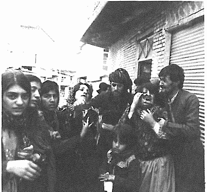
خبر از کشتار تازه ای آورده اند

هر روز که می گذرد از صولت نیروی سرکوبگر کاسته می شود و راه مقاومت جمعی تسهیل می گردد. امسال این مقاومت در همه شهرها مظاهر برجسته ای داشت. نفرت خود ویژه کرد از رژیم، با هر آمد عمومی مقاومت توده ای در دوره جنگ شهرها ترکیب شد و به مبارزه در شهرها ابعاد تازه ای داد. شهرهای کردستان شامل تظاهرات متعددی بود. مصیبت های ناشی از دو جنگ - جنگ رژیم علیه کردستان و جنگ ایران و عراق - ابعاد وحشتناکی یافت که زمینه ساز اعتراضات توده ای مختلفی شد. در بیرانشهر و نقده کار به زدو خورد مردم با پاسداران کشید. سفر چندین بار شاهد تظاهرات بود. مهاباد و سنندج تحرک خاصی یافتند.