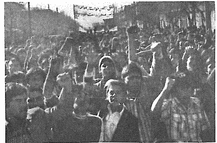
جوانان ترکمن فریاد "صلح، زمین، آزادی" سر می‌دهند.

تشکیل و تقویت شورای مدرسه، گسترش فعالیت‌های فوق برنامه و مقابله با اقدامات و سیاست‌های ارتجاعی انجمن‌های اسلامی را در پیش گرفتند. دانشجویان هوادار فدائیان خلق که از پیش از انقلاب با نام "دانشجویان پیشگام" گسترده‌ترین فعالیت را در دانشگاه‌های سراسر کشور انجام می‌دادند پس از انقلاب به عنوان رکن جنبش دانشجویی مورد استقبال وسیع دانشجویان قرار می‌گیرند. در انتخابات شورای دانشجوئی بسیاری از دانشکده‌ها و دانشگاه‌ها بیشترین درصد آرایه نام پیشگام به صندوق‌ها ریخته می‌شود. در برخی مراکز آموزش عالی، بیش از ۵۰ درصد دانشجویان به نمایندگان