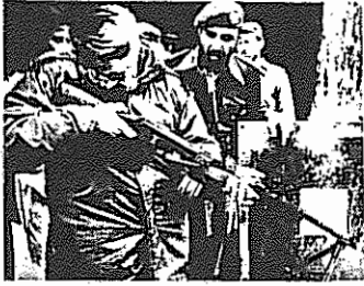
بر ژینسکی در یک اردوگاه آموزش ضد انقلابیون افغانی در پاکستان

هیچیک از مجاهدین، به غیر از فرمانده هانشان، نمی دانند که اینها مامورین ما هستند. این نقشه باید در تمام مراحل آن سری بماند.