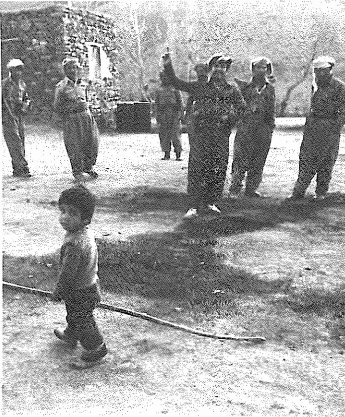
جنینش به خاطر تضمین آینده اوست که این چنین استوار ایستاده است

می توانند همچون "شاهو" و "دالاهو" و "آریابا" در برابر خصم سریلند و استوار بایستند، همچون صخره های این قلعه های پر شکوه محکم و خلل ناپذیر باشند و نشان دهند که اگر خاک کردستان بیش از اینها نیز با کلوله و بمب و خمپاره شخم گردد و زیر و زبر شود کرد همچنان زنده و رزمنده است •