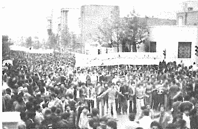
نظارات ده‌ها هزار نفری انجام یافته به دعوت سازمان دانشجویان پیشگام

در سراسر ترکمن صحرا جوانان روستایی به طور یکپارچه به مبارزه انقلابی جلب می‌گردند.