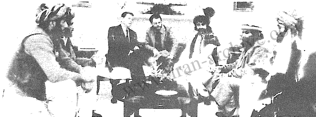
سران گروه های ضد انقلابی افغانی در حضور اربابان ریگان

تحقیقات نشان داد که بمب در یک چمدان کوچک به فرودگاه آورده