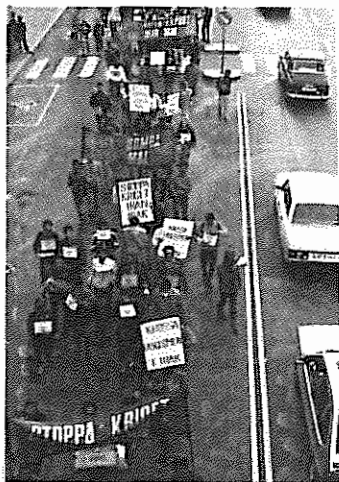
صحنه ای از راهپیمایی ضد جنگ در استکهلم

در سالگرد جنگ ایران و عراق شهر سوئدی گوتنبرگ نیز شاهد تظاهرات اعتراضی علیه تداوم جنگ بود. در روزهای ۱۹ و ۲۰ سپتامبر در چهار نوبت صبح و عصر اجتماعاتی به منظور دست زدن به حرکات افشاکرانه علیه رژیم‌های ضد مردمی ایران و عراق برپا شد. اجتماع کنندگان با پخش اعلامیه و برپایی نمایشانه عکس، مردم سوئد را در جریان حقایق امور مربوط به جنگ قرار می‌دادند. برجسته‌ترین حرکت اعتراضی علیه جنگ در شهر گوتنبرگ در روز ۲۱ سپتامبر به دعوت "کمیته سوئدی علیه جنگ ایران و عراق" صورت پذیرفت. در این روز تظاهراتی در مرکز این شهر برپا شد. این تظاهرات از سوی سازمانهای سیاسی مترقی سوئدی و از جمله حزب کمونیست‌های چپ سوئد، حزب کمونیست کارگری سوئد و سازمانهای جوانان احزاب مذکور مورد حمایت قرار گرفت.