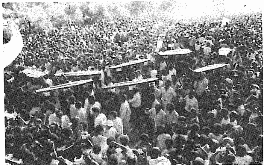
در تشییع جنازه مقتولین حوادث اخیر، ۴۰ هزار نفر شرکت کردند.

در چندین شهرک سیاهپوستان در حوالی کیپ‌تاون و شرق استان کاپ طی هفته گذشته نژاد پرستان علیه مردم به عملیات تروریستی متوسل شدند. از جمله یک فرد سیاهپوست هنگام تفتیش خانه‌ای توسط پلیس در شهرک ورپلاس در نزدیکی پولات الیزابت به ضرب کلوله پلیس به قتل رسید. روز سه شنبه، شرکت کنندگان در مراسم