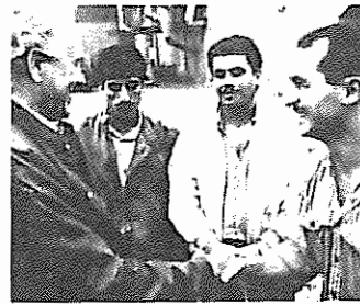
دبیر اول حزب کمونیست دانمارک در میان پناهندگان سیاسی

روزنامه پتریوت در پایان افزود: این سازمان پیوسته برای اتحاد بین تمام نیروهای مردمی در زیر لوای جبهه متحد خلق... مبارزه می‌کند.