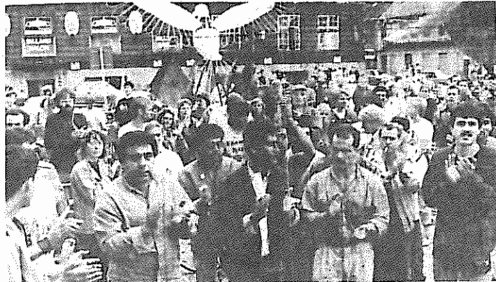
پناهندگان در اجتماع پشتیبانی از پناهندگان سیاسی که به دعوت حزب کمونیست و سندیکامای کارگری برپا شد.

مردم دانمارک بویژه کارگران این کشور برای مقابله با ناهنجاری های موجود دست به اقدامات گسترده ای زده اند که برجسته ترین آنها اعتصاب بزرگ کارگران در بهار سال جاری بود. گسترش این مبارزات نیروهای ارتجاعی را دچار وحشت ساخته است. آنها برای انحراف افکار از مشکلات جاری تبلیغات ضد خارجی را دامن زده اند و ادعا می کنند که علت بیکاری