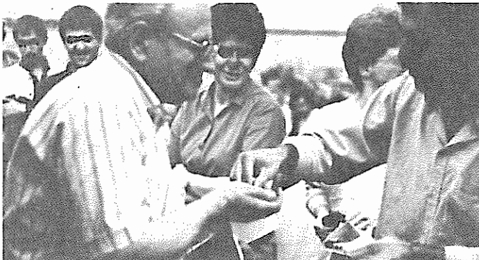
رفیق هورست اشمیت در حاز خریدن قبضه مالی سازمان

با آغاز دور دوم بیمارانهی مناطق مسکونی از طرف دو رژیم ارتجاعی و ضد مردمی ایران و عراق، برای افشای دو رژیم و آگاهی افکار عمومی از فجایع جنگ، و نیز افشای گروه مزدوران اعزامی رژیم جمهوری اسلامی به سرپرستی "بشارتی" که اخیراً به دهلی رفته بودند، هواداران