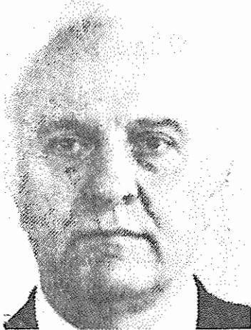
ادوارد شوارد نادره وزیر امور خارجه جدید شوروی

و هم در اشکال و شیوه های کار حزبی و دولتی و در بنکارگیری کادرها در رهبری و در پایه است. دبیر کل حزب کمونیست اتحاد شوروی در ادامه سخنان خود افزود اتحاد شوروی اینک در مرحله حساسی قرار دارد که ملی آن مشی استراتژیک برای یک دوره زمانی نسبتا طولانی تعیین شده و در برنامه حزب تغییراتی داده خواهد شد. گورباچف گفت "در این شرایط مشخص، پلنوم کمیته مرکزی حزب کمونیست اتحاد شوروی با توجه به وتالیف مرحله کنونی لازم دانست که دبیر کل کمیته مرکزی حزب بیشترین نیروی خود را بر روی سازماندهی کار ارکان های مرکزی حزب و یکپارچه کردن تلاشهای سازمانهای حزبی، دولتی و اجتماعی نماید تا مشی در پیش گرفته شده با موفقیت تحقق یابد".