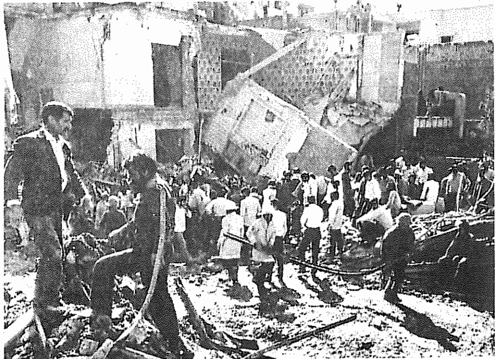
مرک، ویرانی، آوارگی و فلاکت حاصل جنگ طلبی‌های رژیم خمینی

دو رژیم که همه توان خود را صرف انهدام و ویرانی دو کشور و کشتار مردم کرده‌اند، از هم اکنون نشان می‌دهند که باتوقف جنگ شهرها در جستجوی فرصت برای ترمیم توان از دست رفته‌شان می‌باشند. رهبر رژیم عراق اعلام داشته است که در صورت