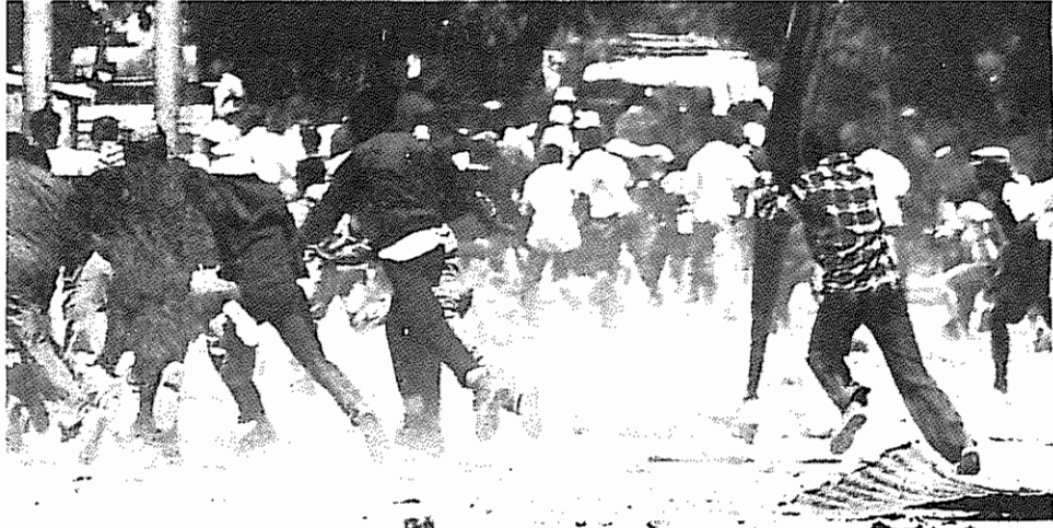
تظاهرات مردم آفریقای جنوبی علیه رژیم آپارتاید.

انتقال یافته بود، ایراد ضربه به جمجمه مقتول را تأیید کرد. همچنین "آندریس رادیتسلا"، از رهبران سندیکای کارگران صنایع شیمیایی، اندکی پس از آزادی از بازداشتگاه پلیس نژادپرست، در نتیجه ضربه ای که به مغزش وارد آمده بود، درگذشت. تشییع جنازه وی به تظاهرات چند هزار نفره علیه رژیم آپارتاید تبدیل شد.