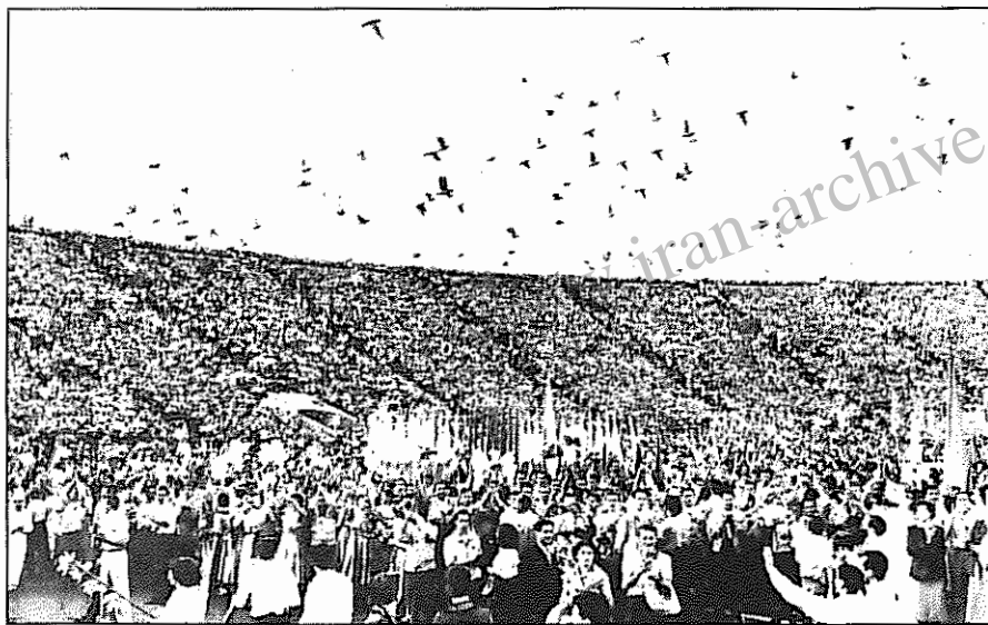
جشنواره جهانی جوانان و دانشجویان، وروش-۱۹۵۵

برتولت برشت نویسنده، شاعر و کارگردان به نام