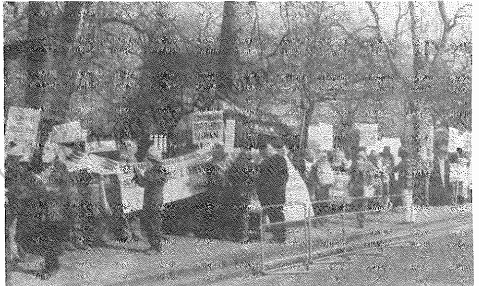
تظاهرات علیه تداوم جنگ ایران و عراق در انگلستان

همچنین در طی کنفرانس در روز ۲۷ مارس جلسه ای توسط نمایندگان جوانان فدائی خلق ایران - بریتانیا و "اتحادیه دانشجویان عراقی" و با حضور نمایندگان فانی از سوئد، آفریقای جنوبی و حدود ۹۰ نفر شرکت کننده دیسرت ترتیب داده شد در بخشی از این جلسه سخنران ایرانی توضیحاتی در مورد اوضاع ایران، وضعیت جوانان و دانشجویان و اختلاف موجود در مراکز آموزشی ایران ابراز داشت. کنفرانس اتحادیه سراسری دانشجویان اسکاتلند نیز در روزهای ۱۶ و ۱۷ مارس در شهر "دندی" برگزار گردید. در این کنفرانس که با شرکت بیش از ۱۰۰ نماینده از کالجها و دانشگاههای اسکاتلند برگزار شد، قطعنامه هایی نیز در ارتباط با