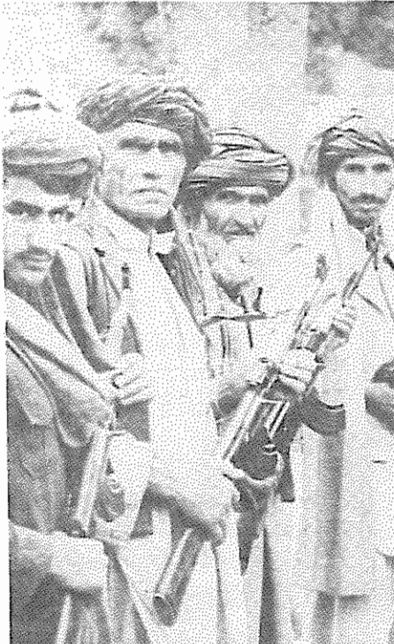
مدافعین انقلاب ثور

اشرار که قسم خورده بودند از رسول انتقام بگیرند، هسر وی را ربوده و دوتن از معاونینش، را به