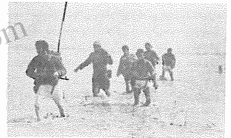
جنگ در لجنزار

در هفته گذشته جمهوری اسلامی مساله استفاده عراق از سلاحهای شیمیایی را به عنوان محور حرکت تبلیغی خود در مجامع بین المللی برگزید و عراق نیز هشدار داد که جمهوری اسلامی قریباً تصمیم دارد یک حمله بزرگ را آغاز کند.