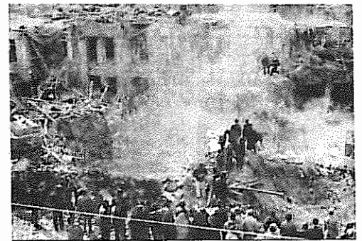
باختران بعد از حملات موشکی

روز یکشنبه ۵ شهر ایران و نیز یادگان حسین آباد مورد حمله هواپیماهای عراقی قرار گرفت. جت‌های عراقی شب دوشنبه مریوان و جنوب شهر تهران را بمباران کردند. بمباران تهران در این شب که یکی از سنگین‌ترین حمله هواپیماهای عراقی به مرکز بود، تلفات و خسارات شدیدی به بار آورد. گفته می‌شود تا فاصله ۲۰ خانه از مرکز انفجار بمب منازل مسکونی ویران شده‌اند. متعاقب این حمله از سوی جمهوری اسلامی، موشک دیگری به جانب بغداد شلیک شد. علاوه بر حمله موشکی به بغداد، به شهر میدان عراق نیز یک حمله هوایی انجام گرفت و بر روی شهرهای بصره، سید صادق، حلبچه و شاندرلی نیز به شدت آتش کشیده شد. در روز دوشنبه صانعی در مراسم ویژه ۱۲ فروردین تهران تأکید کرد که جتنی تا سرنگونی صدام ادامه خواهد داشت.