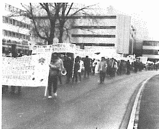
بقیه در صفحه ۹ نظارات علیه جنگ ایران و عراق در بن آلمان فدرال

به دعوت فدائیان خلق ایران (اکثریت) و سازمان های حزب توده ایران در خارج از کشور برای اعتراض به تداوم جنگ خانمانسوز توسط رژیم جمهوری اسلامی و بمباران مناطق مسکونی توسط رژیم های عراق و ایران، نظارات و حرکات اعتراضی گسترده‌ای در بسیاری از شهرها و کشورهای جهان صورت پذیرفت. ما در شماره پیش نشریه "اکثریت" گزارش این اقدامات را در شهرهای بن (آلمان فدرال)، پاریس، کپنهاک (دانمارک)، آتن (یونان)، استکهلم و کوهنبرگ (سوئد)، درج نمودیم. اینک به انعکاس دنباله این گزارشات در تعداد دیگری از شهرها و کشورهای جهان می‌پردازیم.