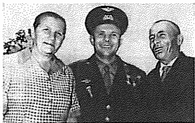
یوری گاگارین به همراه پدر و مادرش

حسابش همیشه تمیز بود. آنروزها کتاب درسی کم داشتیم و هر کتابی را چند نفر از بچه‌ها می‌خواندند. یوری به بقیه بچه‌ها یاد می‌داد که از کتابشان خوب نگهداری کنند. کتابهایشان همیشه بخوبی جلد شده بود و باخط خوش در آن نوشته بودند.