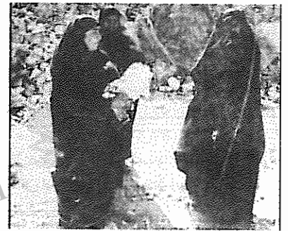
تهران، عزیزان از دست رفته، خانه های ویران شده

خمینی و دیگر رهبران رژیم در سخنرانی های اخیر خود، در همان حال که فریاد "جنگ، جنگ، جنگ" را