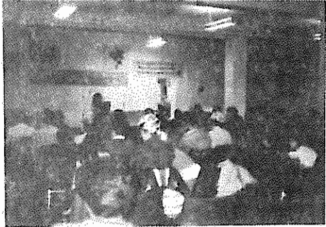
صحنه‌ای از مراسم جشن سازمان در واشنگتن

در آغاز پس از خیرمقدم به حضار متن مختصری درباره تاریخچه سازمان به زبانهای فارسی و انگلیسی خوانده شد. شعرهایی به زبان انگلیسی و فارسی دکلمه گردید و چندین پیام همبستگی قرائت گردید. شرایط دشوار زندانیان سیاسی در ایران نیز برای شرکت کنندگان در جشن تشریح شد.