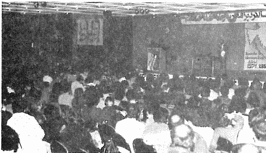
در صفحه ۲