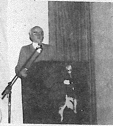
رفیق کارکر عضو کمیته مرکزی حزب کمونیست اتریش حین سخنرانی در جشن سازمان

"به نام کمونیستهای مراکشی پرشورترین شادباشهای خود را انتشار کرده، حمایت کامل خود را از مبارزتان برای ایرانی پیشرفته، آزاد و دموکراتیک، و رها شده از بند تاریک اندیشی و فشری‌گری ابراز می‌داریم".