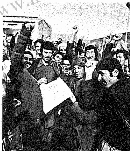
ابرازشاد مانی مردم را آغاز مرحله نوین انقلاب

اطلاعات منابع موثق حاکی از آنست که امین پس از انقلاب شورنیز به همکاری با امپریالیسم آمریکا ادامه داد. وی هنگامی که در سال ۱۹۶۲ تا ۱۹۶۴ در آمریکا تحصیل کرد، تأیید می کنند امین (که در آن زمان مقیم آمریکا بود) تماسهای نزدیکی با آمریکایی هائی داشت که به جاسوسی و فعالیت برای سیا اشتها داشتند. ما دقیقاً اطلاع داریم که کدام یک از آنان همکاری امین را جلب و به وی دستور فعالیت جاسوسی در حزب ما را داد. ما می توانیم دقیقاً بگوییم امین در فاصله ۱۹۷۳ تا ۱۹۷۸ چه وقت و با چه کسی از سازمان سیا ملاقات کرد و از آنان ماموریت گرفت تا به حزب ضربه بزند.