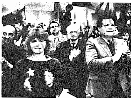
رفیق هربرت میس صد رز حزب کمونیست آلمان فدرال در کنگره (اس.د.آ.یت)

استقبال پر شور نمایندگان کنگره از میهمانان خارجی باردیگر تأکیدی بود بر خصلت عمیقاً انترناسیونالیستی سازمان جوانان کارگر سوسیالیست آلمان.