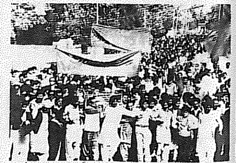
صحنه ای از تظاهرات مردم در هنگام تشییح جنازه فیض احمد فیض

تشییح جنازه فیض احمد فیض به یک تظاهرات بزرگ ضد دیکتاتوری بدل گشت. در هنگام به خاک سپاری او کارگران پاکستان