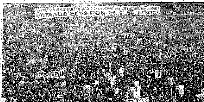
بیش از ۳۰۰ هزار نفر در یک میتینگ انتخاباتی در ماناگوا پشتیبانی خود را از دولت انقلابی اعلام کردند.

در طول این پنج سال انقلاب همه تصمیماتی که توسط ارگان رهبری جبهه ساندینیستی آزادی ملی که متشکل از سه تن رفیق فرمانده انتخاب شده اند، ابتدا رفیقانسه مورد بحث قرار گرفته و سپس با اتفاق آرا تصویب شده اند.