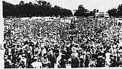
صاحبان ۵۰ هزار نفره در برلین

های آلمان، اختصاص ۵۰ میلیارد مارک بودجه به يك برنامه دولتی اشتغال زا، در کنار کاهش ساعات کار به ۳۵ ساعت در هفته، می تواند بطور اساسی ابعاد فاجعه بیکاری جمعی را کاهش دهد، دولت آلمان فدرال بخش بزرگی از بودجه خود را به برنامه های تسلیحاتی اختصاص می دهد و در عوض، بطور مستمر از ارقام مربوط به میمه های اجتماعی می کاهد.