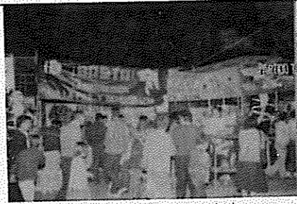
غرقه حزب و سازمان در جشن حزب کمونیست کاتالونیا

★ از تاریخ ۳۰ اوت تا ۱۸ سپتامبر در شهر یاد و جشن مطبوعاتی "آوانت" ارگان حزب