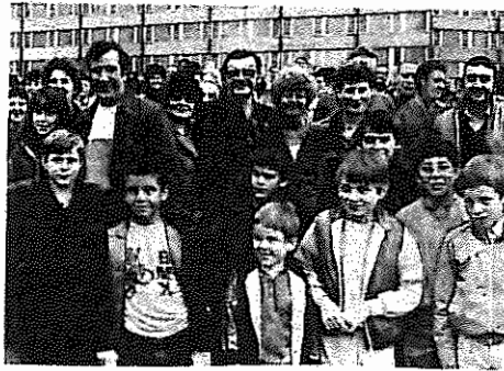
جمعی از معدنچیان اعتصابی بریتانیا همراه با خانواده هایشان در مسکو

معدنچیان فرانسه ضمن اعلام همبستگی با اتحادیه کارگران معدنچی بریتانیا اظهار نمود: "چگونه می توانیم بستن معادن و بیکار کردن دهها هزار کارگر را بپذیریم در حالیکه اروپا سالانه دهها میلیون تن زغال سنگ - از جمله زغال سنگهای آفریقای جنوبی که هنوز به خون و عرق کارگران معدنچی سیاه پوست، قربانیان رژیم آپارتاید آغشته است را وارد می کند."