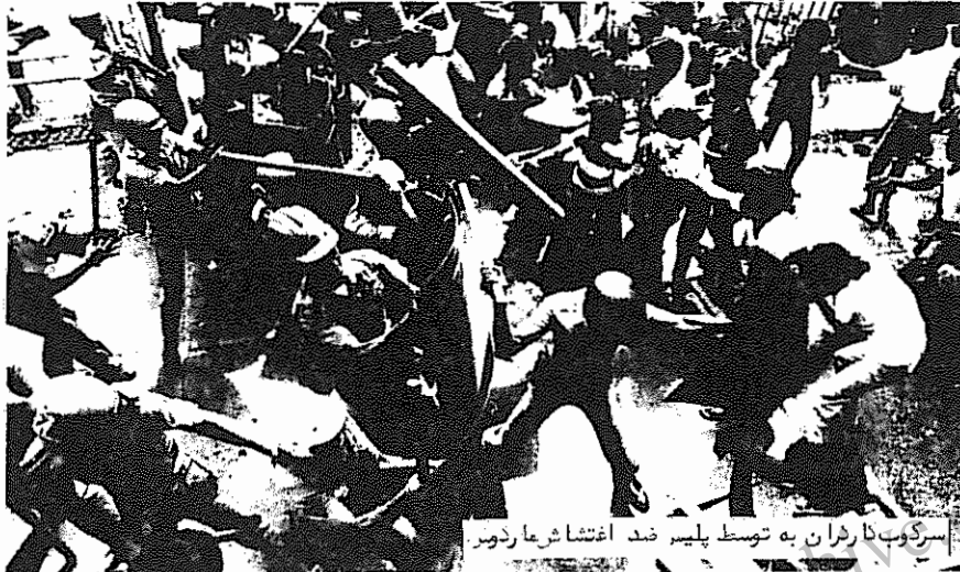
سرکوب نارشان به توسط پلیس ضد اغتشاش مازکوس.

حکومت مازکوس از سالها پیش همواره با سرکوب ، ترور و جنایت همراه بوده است . در فیلیپین ، شخص مازکوس ، بعنوان رئیس ، جمهور اختیار دارد تا بجای قانون ، با "فرامین"