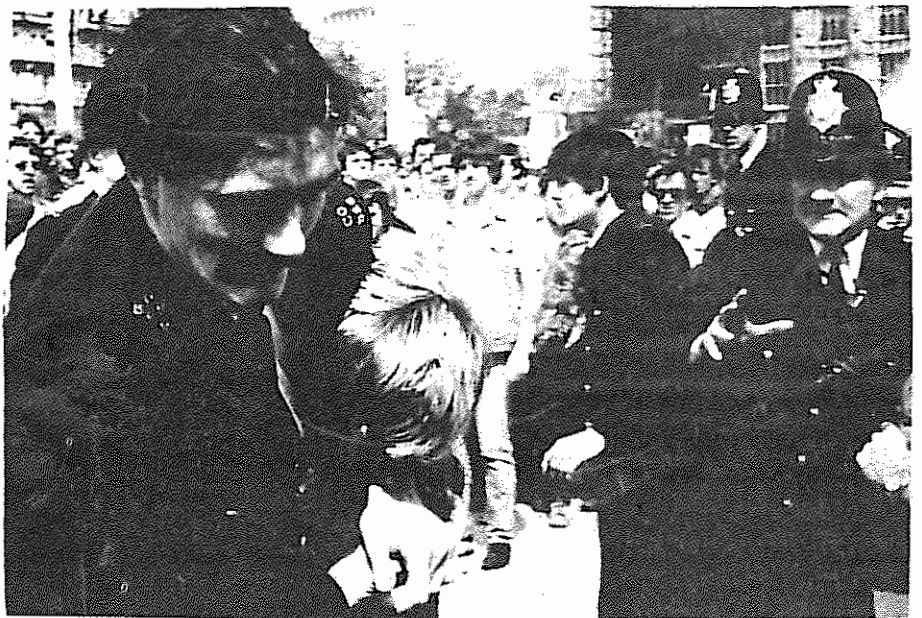
پلیس انگلستان در حال دستگیر کردن یکی از معدنچیان اعتصابی

پشتیبانی TUC از معدنچیان، پیروزی بزرگی برای کارگران اعتصابی و کل طبقه کارگر بریتانیا و ضربه مهمی به قوانین ضد کارگری و ضد اتحادیه‌ای دولت محافظه کار می‌باشد. حزب کمونیست بریتانیا به دنبال اعلام پشتیبانی TUC از این تصمیم استقبال نمود و خواستار آن شد که قطعنامه اتحادیه شوراهای کارگری بریتانیا در باره اعتصاب معدنچیان، با آکسیونهای مختلفی در سراسر کشور، به موقدا اجرا گذاشته شود. از نظر حزب کمونیست، "این قطعنامه بیش از پیش در توده‌های معدنچیان، اعتصابیون، همبستگی کامل مالی برای خانواده آنها و قطع رساندن زغال سنگ به مناطق صنعتی، موثر خواهد بود."