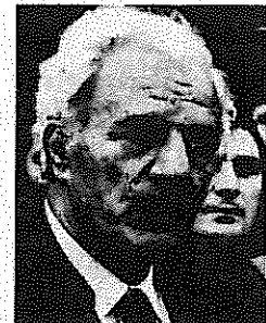
فلوراکیس که در ۲۰ ژوئیه ۱۹۱۴ به دنیا آمد، از او ان جوانی فعالیت در جنبش دمکراتیک و

رفیق هاریلاوس فلوراکیس، دبیر کل حزب کمونیست یونان، ۷۰ ساله شد.