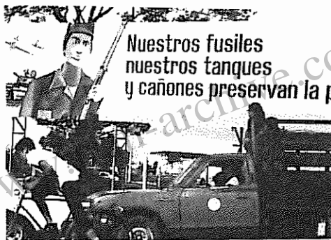
۱- تفنگچیان، تانکچیان و توپچیان به صلح خدمت می کنند (شعاری در ماناگوئه)

اینرا از قبل بگویم که تمامی این فشارها و تضحیات بر علیه خلق ما برای ما غیر منتظره نبود. خلق ما از روزی که تصمیم به آزادی گرفت، بر روی تمامی این مسایل فکر کرده بود. لیکن باید گفت که این توطئه ها، خلق ما را مصمم تر گردانید که از آزادی سود، از استقلال خود و از انقلاب خود دفاع کند. این توطئه ها باعث گردید که خلق به یک قدرت بی نهایت قوی معنوی دست یابد و صفوف خود را مستحکم تر گرداند. هم اکنون در نیکاراگوئه، خلق ما از نوجوانان ۱۲- ساله تا پیرمردان ۶۰ ساله، مسلح هستند و تصمیم به دفاع از شرافت و حیثیت انسانی خود گرفته اند. بزرگترین توطئه ها را چنین خلقی قادر به درهم کوبیدن است و درهم خواهد کوبید.