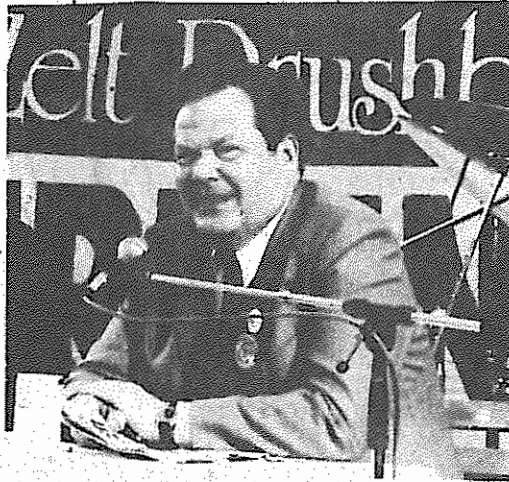
رفیق هریرت میس رهبر حزب کمونیست آلمان در یک جلسه پرسش و پاسخ که در جریان جشن برگزار شد

زندانیان سیاسی میهن پرست و ضد امپریالیست راهر چه ساترنگوش بشرت ترقی خواه جهان برسانند شرکت کنندگان در جشن، با ماضیومارها، و حشیری نکاند هدیه حکام شکنجه گرج ۱۰۰ را محکوم نموده و خواستار قطع فوری شکنجه های غیر انسانی جسمی - روانی، در زندانهای قرون وسطایی