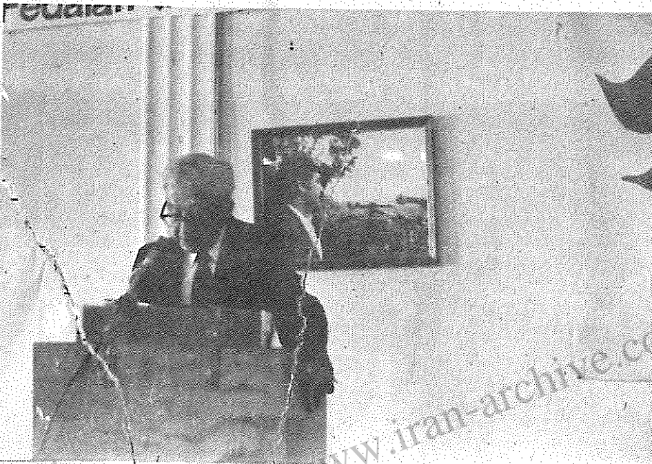
رفیق اپتگر عضو کمیته مرکزی حزب کمونیست آمریکا در حال سخنرانی در جشن سیزدهمین سالگرد تأسیس سازمان فدائیان خلق ایران (اکثريت) در شهر لس آنجلس

جشن آغاز چهاردهمین سال زندگی انقلابی و پرافتخار سازمان فدائیان خلق ایران (اکثريت) در لس آنجلس از سوی ۱۵ حزب و سازمان انقلابی و ترقیخواه جهان برگزار گردید