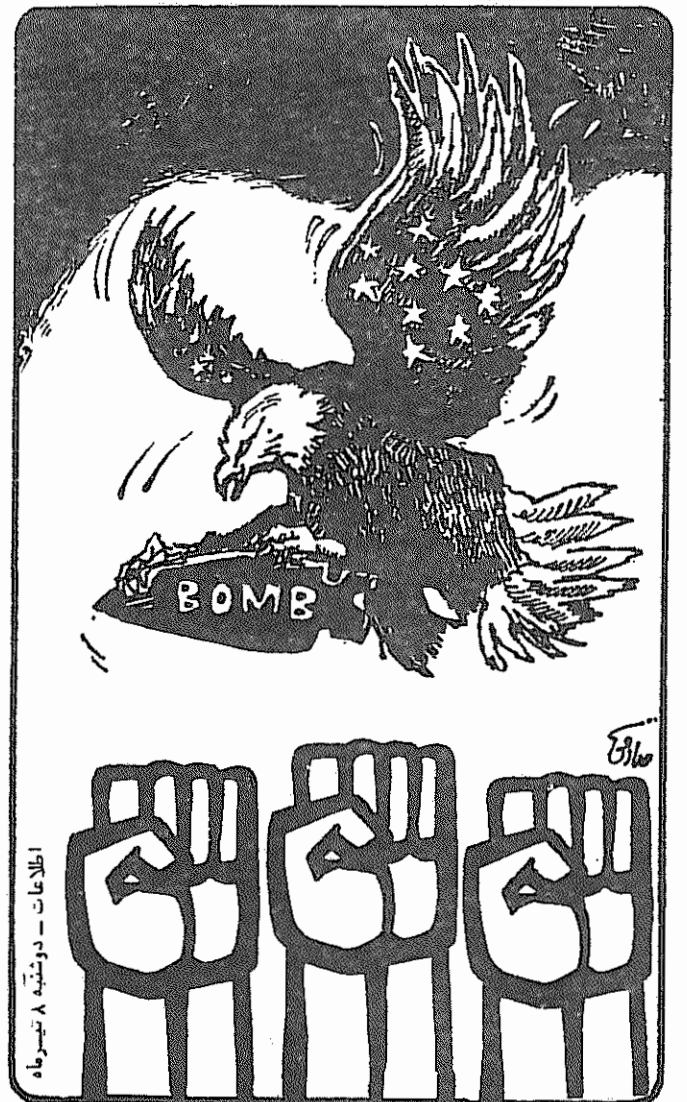
اطلاعات - دوشنبه ۸ تیرماه

اطلاعیه کمیته مرکزی سازمان فدائیان خلق ایران (اکثریت) درباره فاجعه انفجار دفتر مرکزی حزب جمهوری اسلامی