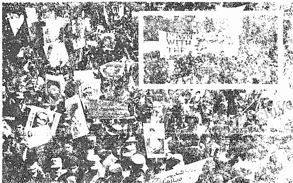
★ تشییع پرشکوه شهدای فاجعه انفجار توسط میلیونها تن از مردم زحمتکش ایران، مشت محکمی بود بر دهان مزدوران امپریالیسم آمریکا. در صفحه ۳