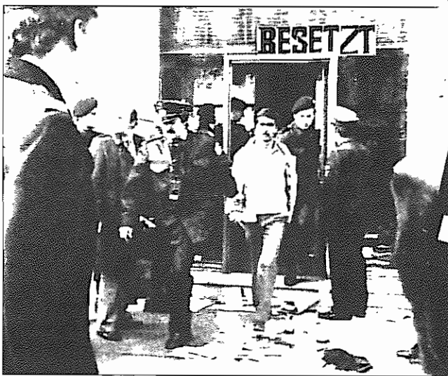
Eine Viertelstunde konnten die Regimegegner sich austoben, dann wurden sie abgeführt