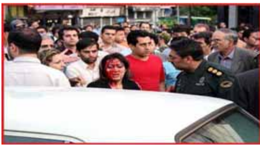
صحنه ای از سرکوب های وحشیانه اخیر و مقاومت مردم!

نشریه سیاسی - خبری چریکهای فدایی خلق ایران ، شماره ۵۵ - ۱۵ خرداد ۱۳۸۶