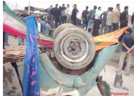
شورش مردم در قائمشهر

تمام عرصه های سیاسی، فرهنگی و اجتماعی سازمان داده و هر ندای مخالفی را وحشیانه سرکوب کرده است. تداوم این روند، به طور طبیعی خشم و نفرت عظیمی را در میان توده های محروم، کارگران، زنان و جوانان برعلیه حکومت دامن زده و انعکاس این نفرت و خشم توده ای هر روز به بهانه های مختلف، در قالب اعتراضات و اعتصابات کارگری و شورش های قهرآمیز، بسیجی کشی و عملیات مسلحانه و ... در گوشه و کنار کشور به منصفه ظهور می رسد.