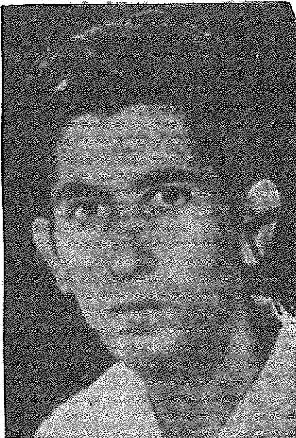
عکس شاهرخ هدایتی که در سراسر کشور توزیع شده است

در روشنگری رژیم همچنین ثابت میکند که با آغاز خیمه شب بازی مصاحبه های ایچ ثابتی در رادیو و تلویزیون سیاست باصطلاح اطلاعاتی آن تخمیر نکرده و همچنان گذشته به صحت هیچ کدام از اخبار و اطلاعیه هایش نمیتوان اطمینان کرد.