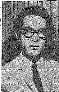
امیر پرویز پورنیا