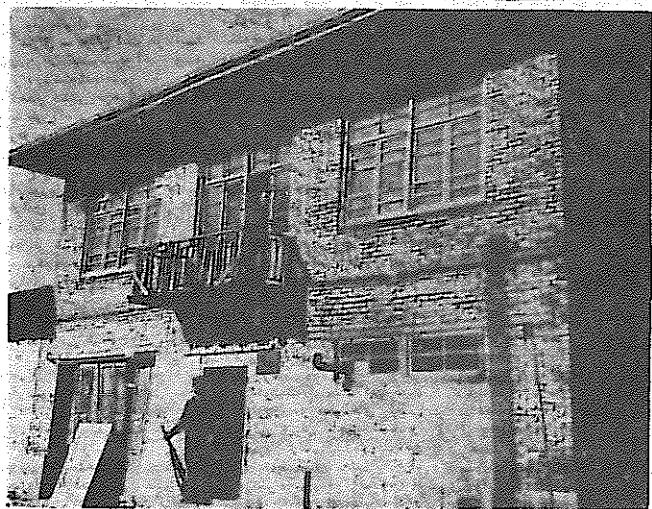
آینجا ساختمان پناهگاه وندارمیری سياهکسل است