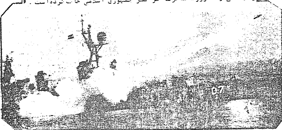
تصویری از جمهوری اسلامی ایران در حاکمیت موشک‌ها و راکتورهای خود در حاکمیت

دو عکس را با هم مقایسه کنید و تفاوت‌ها را مشخص کنید