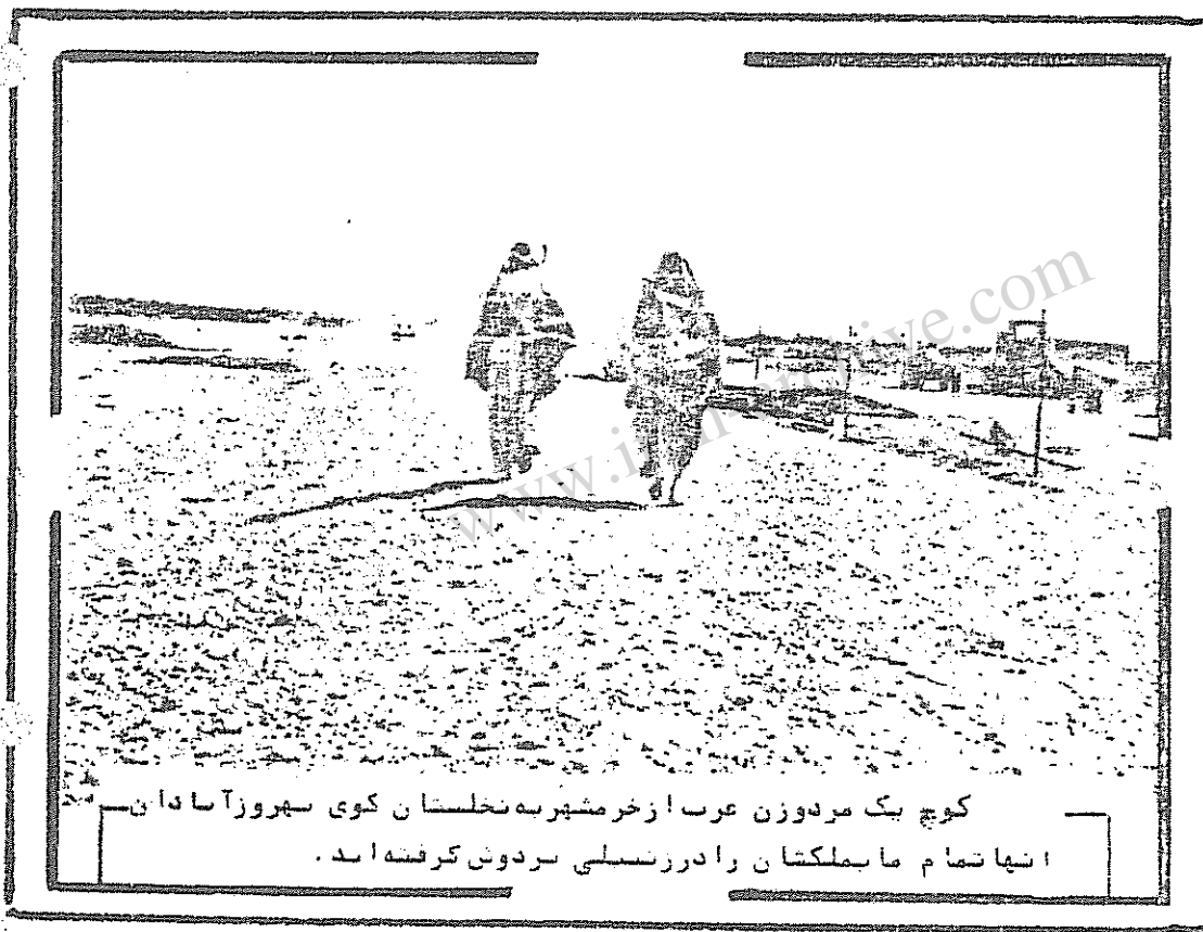
کوچ یک مردوزن عرب از خرمشهر به نخلستان کوی بهروز آبادان - انها تمام ما بملکشان را در زنجیلی بردوش گرفته اند .

یکی از ریش رها کرده های جمهوری اسلامی - خاش کنان فریاد زد ، همون شاه خلاد ، همون شاه خاش برا -تون حوس بود ، واقعا "که حوستو سرتون میزد . زنی که د و بچه همراه داشتو ساکن خرمشهر بود پرسید : مگه شما نمی زنین ؟ مگه شما نمی کشین ؟ شماروی اون خلاد اون خاش را سفید کردین ، بد ساختا برین نومردم ببینین در موردتون چه میگن . مثل کبک