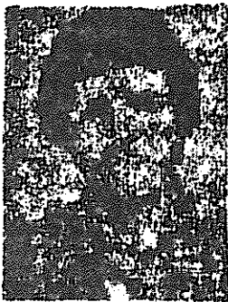
حجت الاسلام بنی جمالی شهید شد

مانگونه که در صفحه ۱۰ روزنامه امروز خبر داده ایم حجت الاسلام والمسلمین سید ناصر بنی جمالی عضو دادگاه مبارزه با منکران به دستمال مزدور آمریکا در تهران به شهادت رسید. مگر حجت الاسلام بنی جمالی صبح امروز بدست ما رسیده که در اینجا چاپ کرده ایم.