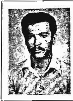
کمونیست بیگنا و گرفتار نهرام حجاب، تیرباران بدست رژیم جمهوری اسلامی