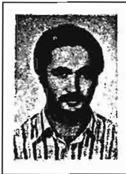
کمونیست بیگنا و گرفتار کامیار، تیرباران بدست رژیم جمهوری اسلامی