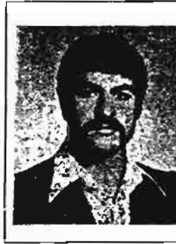
کمونیست بیگنا و گرفتار ثروثیان، تیرباران بدست رژیم جمهوری اسلامی