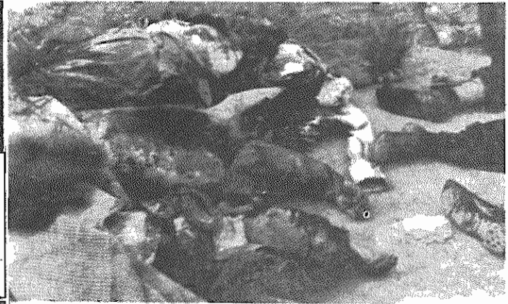
کمال ارفسل عامدر "قارنا" گدنت! ...