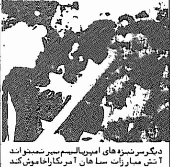
دیگر سرنیزه های امپریالیسم سربا نمیتواند آتش مبارزات ساهان آمريکا را خاموش کند

تجاری از مبارزات کارگران کارخانه نخ زربین صفحه ۳