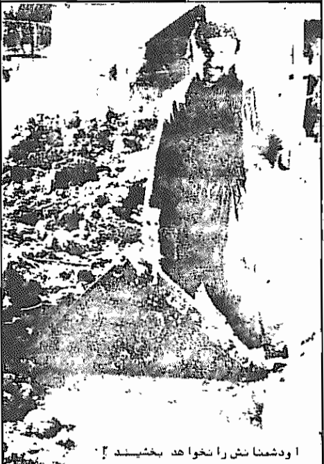
ا دشمنان را نخواهد بخشید!