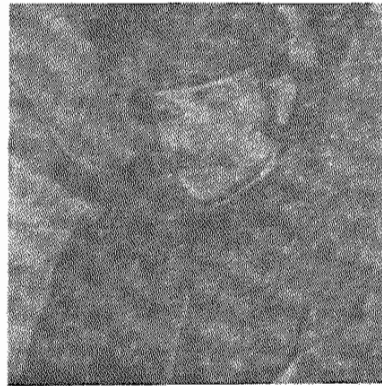
وصیبا مه گلسرخی

" سر تک ندانی خلق ایران همسوسا ساهه من حرفین به مردم جری دیگر نیست . من خوسم را نه بوده های گرسه و با برهنه ایران ندیدم می - کم و سما آسانان فاسست ها که ترردان خلق ایران را بدون هیچ گونه مدرکی عمل گاه می - فرسند ، آسانان داسه سادکه خلق محسروم ایران اسقام چون ترردان خود را خواهد گرفت . حالتان داسه سادکه راه فرطره خون ما صدها ندانی سرمی حسره و روری طلب همه شما را خواهد سکاف ، سما آسانان داسه سادکه حکومت غیر - فاسوسی ایران که در ۲۸ ساه مرداد خلق ایران تخمسیل سده در حال احسار است و در سیرا رود سا اصطلاب تهر آسرتوده های سم کشیده ایران درو و وارگون خواهد شد ."