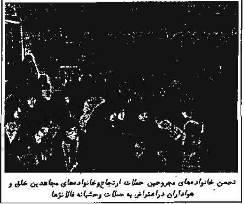
تجمع خانواده‌های مجروحین حملات ارتجاع و خانواده‌های مجاهدین خلق و هواداران در اعتراض به حملات وحشیانه فلاتونما

که در اینجا مشغول کارند، و به این ساختمانها رفت و آمد دارند و فعالیت های سیاسی و انقلابی و اجتماعی و درمانی خودشان را ادامه می‌دهند. در اینجا متحصن شده‌اند. همچنین خانواده‌های شهدا و زندانیان مجاهد که تا سلطه ناه در زندان بودند و مردم آنها را آزاد کردند و نیز خانواده کارکنان و اعضا سازمان که در این ساختمانها کار می‌کنند، در اینجا متحصن شده‌اند. و خواست آنها رسیدگی، محاکمه و مجازات و محکوم شدن این افراد و افشاشدن اقدامات وحشیانه آنها از طرف مقامات رسمی است.