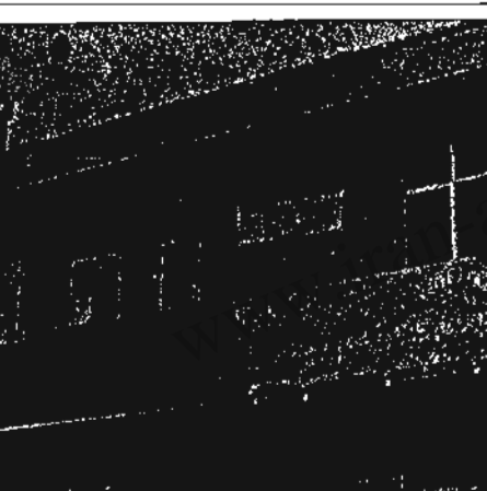
نمای ساختمان امداد پزشکی مجاهدین و آشار گلوله‌های مرتجعین

گزارش کوتاهی از چگونگی عوامل ارتجاع به مرکز امداد پزشکی بسم الله الرحمن الرحیم. دیشب از حدود ساعت ۱۱، مگر اطلاع میسر شد که افرادی جفاکار ارتجاع در همانجا که معمولاً مستحکم سازماندهی میشوند تا به اینجا و آنجا حمله کنند، دوباره جمع شدند و