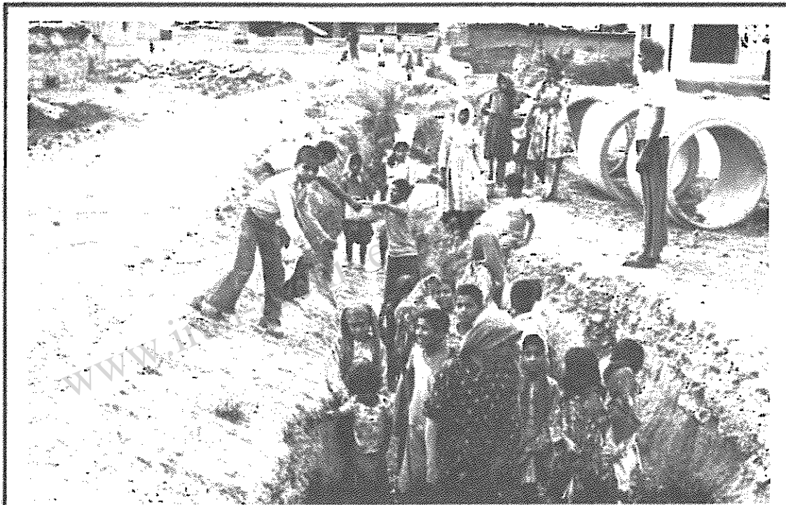
رودخانه‌ای که از سه روستا میگذرد و به روستای "ده مرده" می‌رسد این روستا از این رودخانه بعنوان آب‌آشامیدنی استفاده میکند.