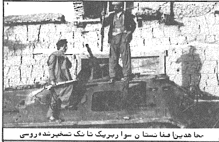
مجا هدیبا فغانستان سوار بر بیک تاکسیر شده روسی

در حالیکه امواج خشم و اعتراض مردم ایران و جهان علیه تجاوز نظامی وحشیانه سوسیال امپریالیسم به خاک افغانستان هر دم فزونی می گیرد، نمایندگان خط ۳، خط چریکی و خط ۴ در سکوت و بی تفاوتی بخشایش ناپذیری فرو رفته اند. ۲ ماه پس از آغاز جنبش ضد امپریالیستی مردم ایران علیه آمریکا، ما بار دیگر شاهد جدائی عظیم " هواداران طبقه کارگر " از جنبش ضد امپریالیستی توده های خلق می باشیم. اینان که از مبارزه با امپریالیسم آمریکا رو سفید بیرون نیامدند اکنون گویا