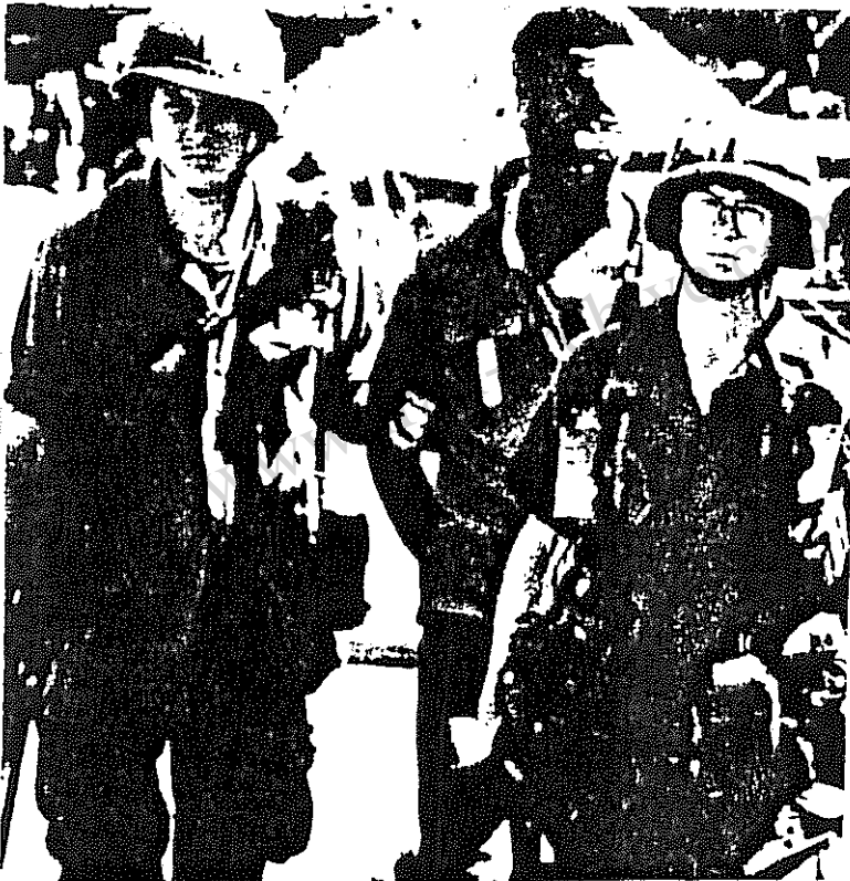
امریالیستهای پانکسی در " گرانادا "

بنیاد هواخواه غرب از نظر اقتصادی و هرچه بیشتر وابسته نمودن آنها به غرب . ۱) " قرار داد امنیت متقابل " ( M S A ) که همانا تعهد حمایت از رژیمهای ضد کمونیست همجوار چین و شوروی است . ۱۹۸۶ — ♦ تخصیص کمک نظامی به مبلغ ۱۰۰ میلیون دلار به ضد انقلابیین کنترا علیه دولت ساندنیست نیکاراگوئه .