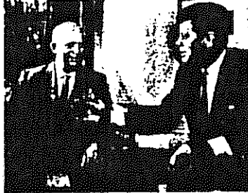
Kennedy and Khrushchev in Vienna