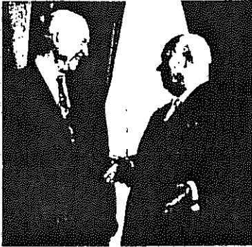
Eisenhower and Khrushchev in Washington