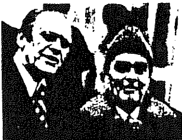
Ford and Brezhnev in Vladivostok