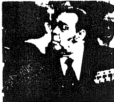
Carter and Brezhnev in Vienna