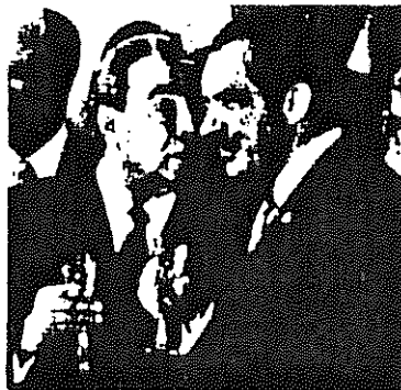
Nixon and Brezhnev in Moscow