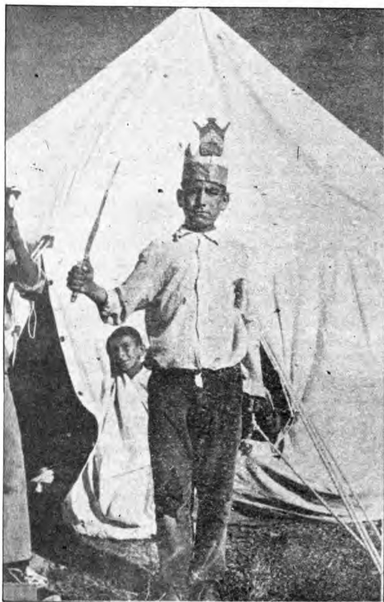
این یکی از عکس های نمایشگاه "سیر انقلاب" است. نوجوانی زاغ نشین با لباسی زنده در مقابل چادری که سهم او و خانواده بر جمعیتش از "تمدن بزرگ!" بود، "شاه شاهان" را به سخره گرفته است.

عصر روز ۱۸ بهمن، مراسمی از سوی اقلیت های مذهبی ایران در تالار وحدت برگزار شد. در این مراسم رهبران و پیروان اقلیت های مذهبی و همچنین حجت الاسلام معاد یخوآه وزیر ارشاد اسلامی شرکت داشتند. ابتدا پیام حجت الاسلام هاشمی رفسنجانی رئیس مجلس شورای اسلامی قرائت شد. سپس حجت الاسلام معاد یخوآه سخن گفت و سخنان خود را چنین پایان داد: "همه ادیان لاقلمی توانند در شعار مرگ بر آمریکا مشترک باشند." بعد از سخنان وزیر ارشاد اسلامی