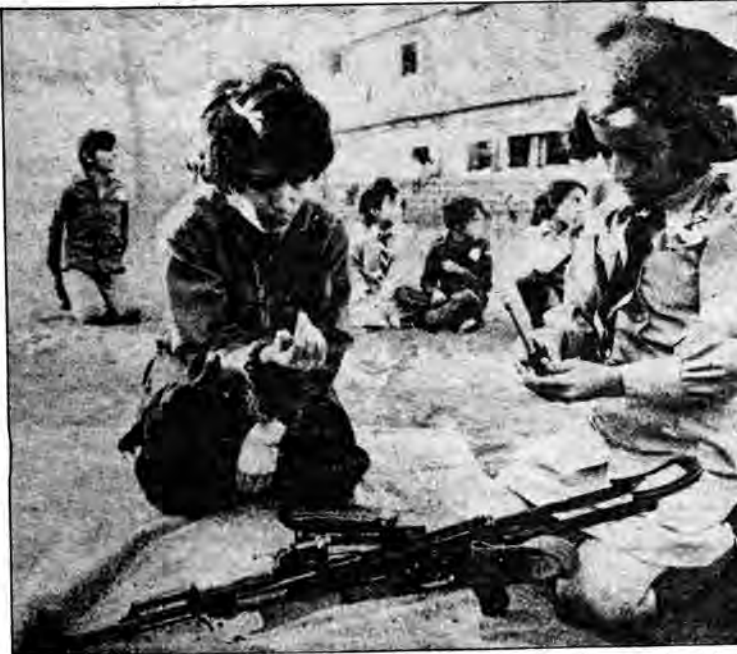
کودکان فلسطینی از همان آغاز نبرد انقلابی با صهیونیسم بسرکردگی آمریکا را می آموزند

آمد و سیاستی نه بگونه دلخواه صهیونیست ها پیش گرفت، توطئه آشوب گاری خود را به اوج دیگری رسانیدند. در مهرماه ۱۳۲۴ (اکتبر ۱۹۴۵) دسته های مسلح صهیونیستی به راه آهن های فلسطینی یورش بردند و در روز ۱ آبان (دوم نوامبر) روز بیست و هشتمین سالگرد انتشار "اعلامیه بالفور"، تل آویوا به صحنه آشوب آفرینی و فتنه انگیزی تبدیل کردند، تظاهرات براه انداختند و قطارهای راه آهن را منجر ساختند. در همان روز سربازان بریتانیایی دست به کشتار یهودیان در قاهره و دیگر شهر-