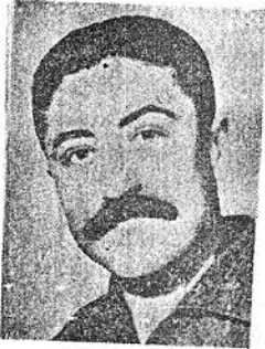
شهید بزرگ انقلاب فلسطین

ابو علی ایاد اسم مستعار ولید احمد نهر عضو کمیته مرکزی جنبش « فتح » و عضو فرماندهی کل نیروهای عاصفه است .