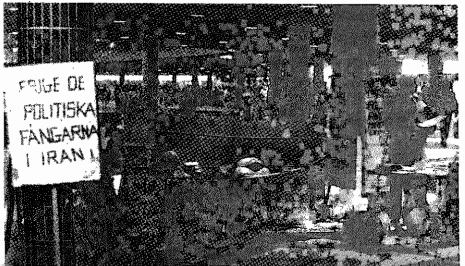
اعتصاب غذای اعتراضی هواداران حزب توده ایران و سازمان فدائیان خلق ایران (اکثریت) در سوئد

خاور میانه تشکیل گردید، حاضرین سپس از استماع آخرین رویداد های ایران، سرکوب وحشیانه حزب توده ایران، شکنجه و آزار اعضای آن و تشکیل دادگاه‌های در بسته نظامی علیه آنان ضمن ابراز همبستگی عمیق با قربانیان این توطئه شوم، اعمال ننگین عمال حکومتی ج ۱۰ را شدیداً محکوم کردند. تعداد زیادی از آنان نیز، ضمن بازدید از غرفه حزب در مراسم، به امضای طومارهای اعتراضی نسبت به اعمال بی‌رویه حکومت ایران علیه مبارزین میهن دوست و به ویژه توده‌های دردمند پرداختند.