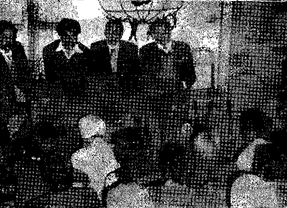
جلسه همبستگی اتحادیه کارگری و حزب کمونیست هندوستان در پنجا ب با حزب توده ایران و اعضای در بند آن

طی برگزاری جلسه فوق ، نامهای از طرف هواداران حزب توده ایران و هواداران سازمان فدائیان خلق ایران ( اکثریت ) در هندوستان بقیه در صفحه ۷