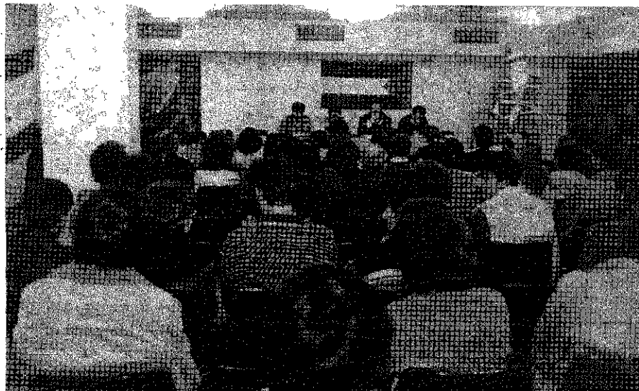
جلسه همبستگی با حزب توده ایران در پارسلن ( اسپانیا )

● روز ۱۲ دسامبر ( ۲۱ آذر ) ، تظاهرات گسترده ای به منظور محکوم کردن دادگاه های نظامی علیه توده ای ها ، از طرف سازمانها و نیرو های مترقی هندوستان در دهلی نو برگزار گردید . تظاهر کنندگان ، ضمن دادن شعارهایی از جمله : " محاکمات نظامی را متوقف کنید " ، جلسات محاکمات باید علنی باشد " ، " آزادی برای کلیه زندانیان ، سیاسی مترقی در ایران " ، پس از طی مسافتی به مقابل سفارت ج ۱۰ در دهلی نو رسیدند و در آنجا بیانیه ای از طرف " انجمن وکلای دمکرات " ، " فدراسیون ملی زنان " ، " فدراسیون سراسری جوانان " و " فدراسیون سراسری دانشجویان هندوستان " ، خوانده شد که به نام کلیه نیروهای مترقی این کشور ، برگزاری دادگاه های در پستیه نظامی را محکوم نموده و پس از تشریح توطئه ای که ماها است علیه حزب توده ایران و سایر نیروهای مترقی تدارک دیده شده است ، به سابقه مبارزاتی درخشان حزب و " متهمین " این دادگاه های فرمایشی پرداخته شده است . در این بیانیه از دولت ایران خواسته شده ، ضمن رعایت موازین حقوق بشر ، محاکمات را متوقف ساخته و جلسات دادگاه را به