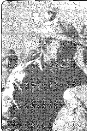
رزمندگان «سواپو» در میان خلق نامی بیا

وتوی ایالات متحده آمریکا و متحدان امپریالیستی آن بار دیگر سرشت خصومت آمیز این کشورها را در برابر جنبش‌های آزادی‌بخش و خلق-های استقلال طلب نشان می‌دهد. همان کشورهای، که پس از تسخیر جاسوس-خانه آمریکا در تهران، کارزار تحریم اقتصادی گسترده را علیه جمهوری اسلامی ایران مبتکر شدند، اینک با مجازات یکی از تجاوزکارترین و ددمنش‌ترین رژیم‌های جهان مخالفت کارشکنانه می‌ورزند. حقا که ربا کاری امپریالیستی حد و مرزی نمی‌شناسد!