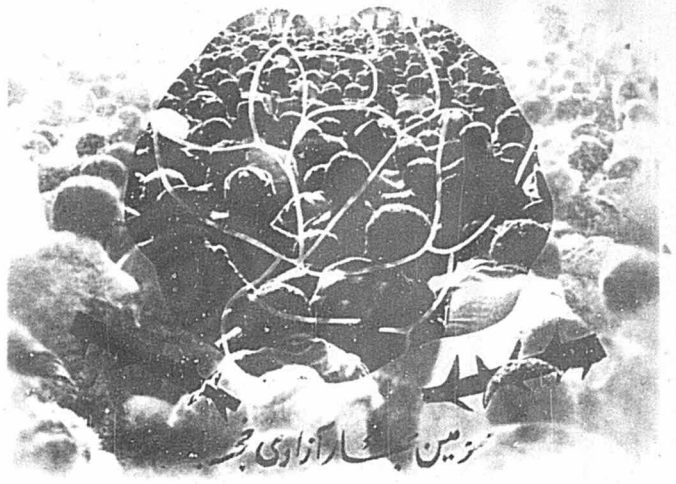
زمین سراسر آزادی

بهمراه نامه‌های فراوانی که از جانب اعضاء، هواداران و دوستان حزب، بمناسبت عید نوروز و سومین بهار آزادی، به کمیته مرکزی رسید، برخی از رفقا و دوستان طرح‌های جالبی نیز فرستاده بودند. بعنوان نمونه طرح فوق از جانب سازمان جوانان توده ایران - گیلان رسیده است.