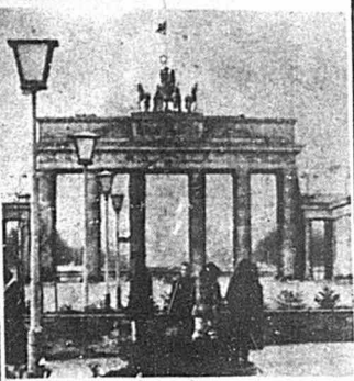
«دروازه براندنبورگ» (برلین، پایتخت جمهوری دمکراتیک آلمان): آنجا که خط تجاوزه و چپاول امپریالیسم پایان مریابد و از مرز سوسیالیسم و صلح فاطمانه پاساداری میشود.