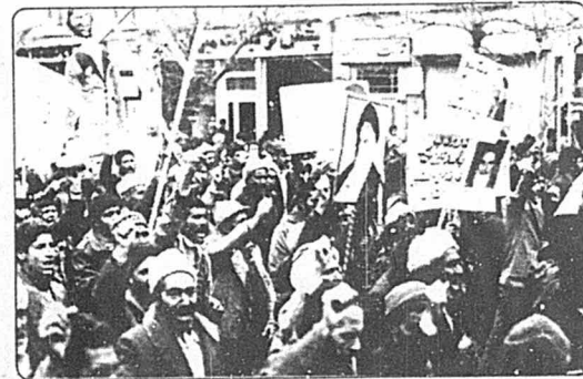
شرکت دهقانان خراسانی در تظاهراتی که جهاد سازندگی مشهد ترتیب داده بود

در مقابل این وظیفه عظیم نمی‌توان قدم عقب گذاشت، می‌توان آن را الهام بخش کوشش‌ها را تلاش‌های بسیار قرار داد. سخن، راه، ارتباط، بهداشت، آموزش، فرهنگ، تاسیسات، کولگان، مدرسه، درمانگاه، مسالخانه، کتابخانه، مسجد، تاسین