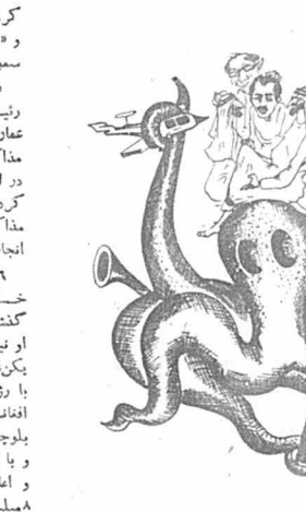
سفر هیگ به خاورمیانه

قبل از این مسافرت، عده‌ای مزبور برای کمک به «بازرگان» افغانی وارد پاکستان شده بودند.