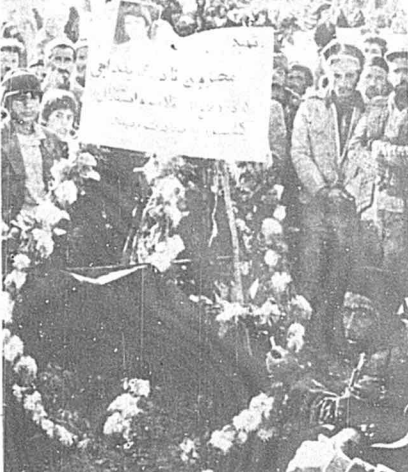
زحمتکشان روستای بلداجی گور رفیق قهرمان را گل‌باران کردند.

با آغاز یورش دارو دسته‌سدام به خاک میهن انقلابی ما، انتشار فراخوان کمیته مرکزی حزب توده ایران، رفیق محزون داوطلبانه