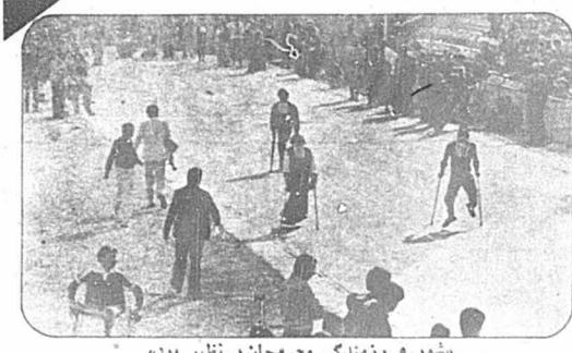
"شور و زرمندگی مجروحان پی نظیر بود"

نمایش های پیش از مسابقه فوتبال اجرا می گردد: ورزش های رزمی، مسابقه ورزش مجروحان و ناسپایان. ورزش دوستانی که بر روی سکوی ایستاده نشسته اند، مخصوصا به ورزش معلولین توجه خاصی نشان می دهند. مسابقه و سلجورانی "امدادی" آغاز می - گردد. نوری که تا حال اول بوده، به ناگهان در میانه راه جوب مسابقه از دستش می افتد. تماشاگران هیجان - زده می شوند، نفر بعدی جلو می افتد و مسابقه را می برد. تماشاگران برای هر دو ورزشکار ابراز احساسات می کنند. مسابقه دو ناسپایان اعلام می شود. هنوز عده ای از خود می پرسند: چگونه عده ای ناسپایان توانند بدون عده ای می گویند: لایق کلکی در کار است! عده ای دیگر خوشش ترند و معتقدند که ورزش حرفه ای است که به مجروحین و ناسپایان امکان داده است، تا استعدادهای خود را پرور دهند و زرمندگی بر تحرک خود را به تمام مردم نمایانند. و عمر از این هم نیست، زیرا روحیه ناسپایان ورزشکاران و جوان معلولین ورزشکار عالی است، و همان است که جمعیت را به شور و هیجان می آورد. مسابقات معلولین و ناسپایان قهرمان بایان می باید، در حالی که سرپرستان، ورزشکاران را در آغوش می گیرند و تماشاگران برای یک یک ورزشکاران ابراز احساسات می کنند. همکار عکاس ما از داخل دوربین نظره ای را نشان می دهد که متاسفانه کشته است: ورزشکاران لباس مرتب و متحدان شکل ندارند. قش سبک که ورزشکاران معلول و ناسپایان نیز همچون دیگر ورزشکاران از امکانات کافی برای ورزش و انجام مسابقات ورزشی برخوردار می شدند.